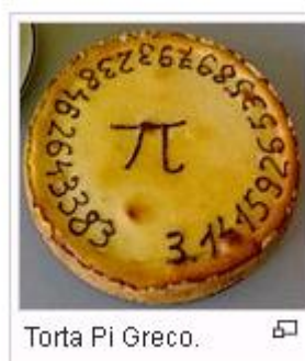
Torta Pi Greco.